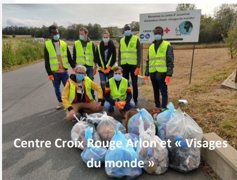
Centre Croix Rouge Arlon et « Visages du monde »