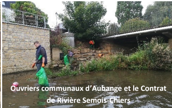
Ouvriers communaux d'Aubange et le Contrat de Rivière Semois-Chiers