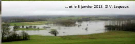
... et le 5 janvier 2018 © V. Lequeux