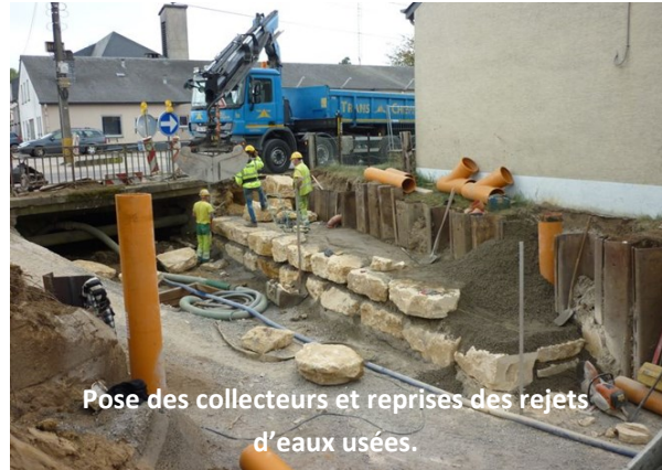
Pose des collecteurs et reprises des rejets d'eaux usées.