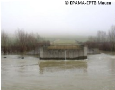
La ZRDC à Mouzon en janvier 2018