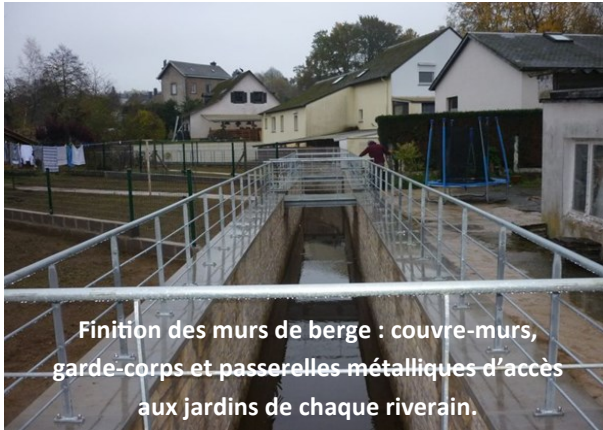
Finition des murs de berge : couvre-murs, garde-corps et passerelles métalliques d'accès aux jardins de chaque riverain.