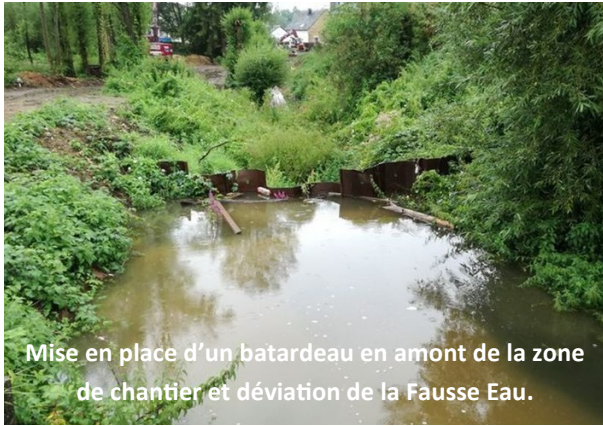
Mise en place d'un batardeau en amont de la zone de chantier et déviation de la Fausse Eau.