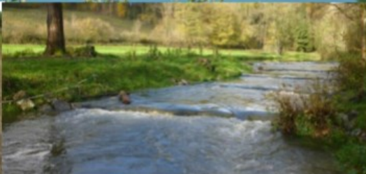
Aménagement mixte réalisé en 2017 sur l'Eau Blanche