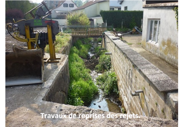
Travaux de reprises des rejets.