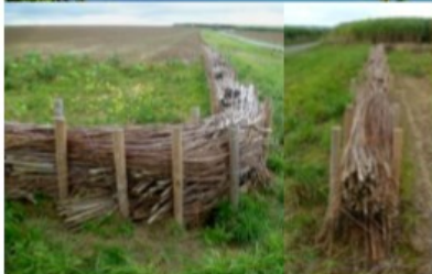
Fascines de branchage contre les coulées de boue