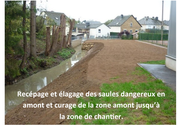
Recépage et élagage des saules dangereux en amont et curage de la zone amont jusqu'à la zone de chantier.