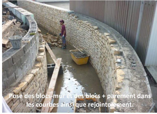
Pose des blocs-mur et des blocs + parement dans les courbes ainsi que rejointoiement.