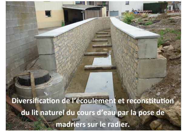
Diversification de l'écoulement et reconstitution du lit naturel du cours d'eau par la pose de madriers sur le radier.