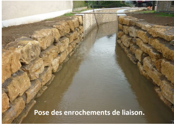
Pose des enrochements de liaison.