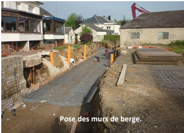
Pose des murs de berge.