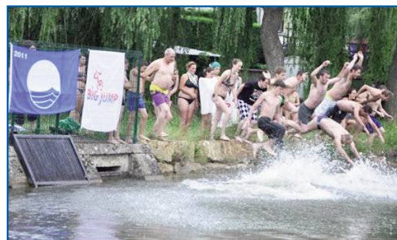
Obtention du label Pavillon bleu et organisation du Big Jump au lac de Conchibois par la Commune de Saint-Léger