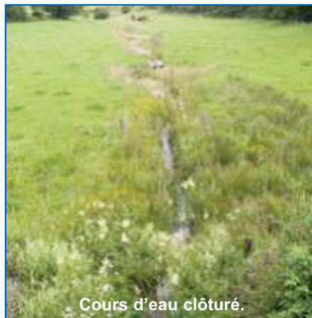
Cours d'eau clôturé.

Le Gouvernement wallon a également adopté un arrêté permettant à chaque éleveur d'obtenir une subvention permettant de couvrir une partie des frais liés à l'installation de clôtures permanentes et d'abreuvoirs (bac de 1000 litres minimum et pompes à museau). La subvention correspond à un maximum de 75 % du montant des travaux.