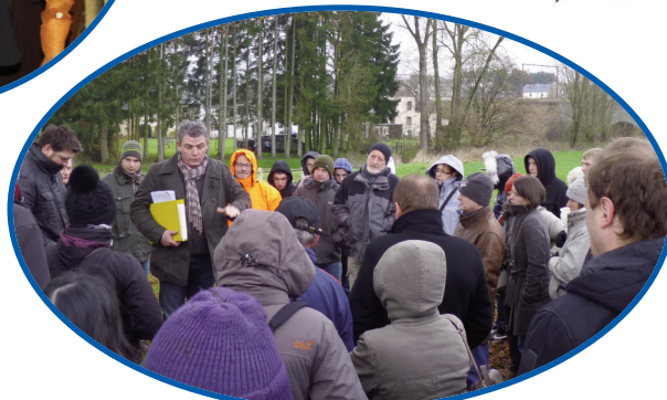
Visite des travaux d'amélioration de l'écoulement de la Rulles à Rulles réalisés par le SPW-DGO3-DCENN