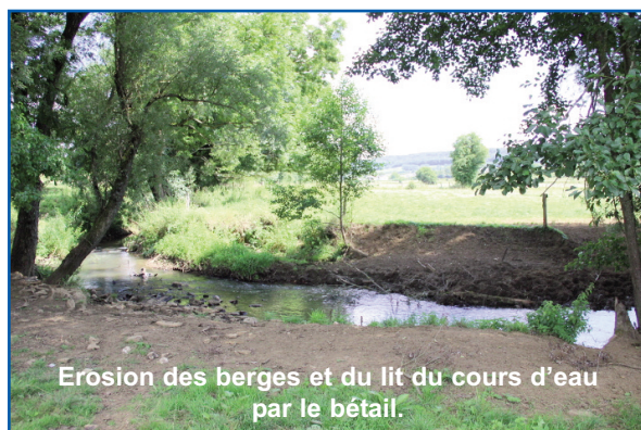
Erosion des berges et du lit du cours d'eau par le bétail.