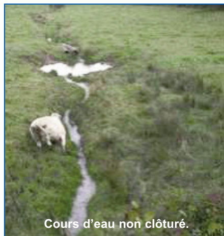
Cours d'eau non clôturé.

Étant donné les Arrêtés existants et l'urgence qu'impose l'Europe à la Wallonie afin d'atteindre un bon état des cours d'eau pour fin 2015 sous peine de sanctions importantes.