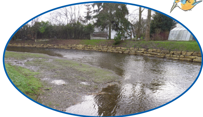
Travaux d'amélioration de l'écoulement de la Rulles.

Les présentations sont disponibles sur le site Internet du Contrat de Rivière ( www.semois-chiers.be ) ou au siège de notre asbl.