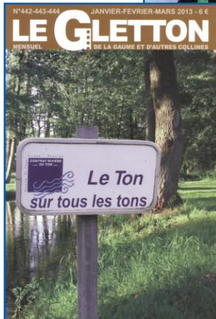
Participation à la rédaction du Gletton début 2013