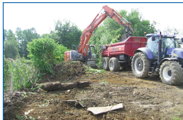
Gestion des renouées du Japon à Virton par le SPW-DGO3-DCENN, la Commune de Virton et le DNF.