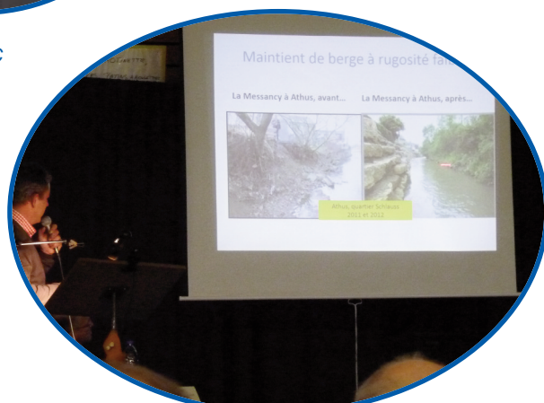
Pierre OTTE SPW-DGO3-DCENN