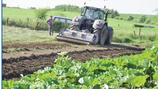
Chantier de gestion de berces du Caucase à Les Bulles (Chiny).

Différents projets sont sur les rails, comme par exemples, la réalisation de l'inventaire de l'ensemble de nos cours d'eau, les journées de l'Eau (du 15 au 30 mars), le projet FEP à Bouillon (création de deux passes à poissons au niveau des barrages existants), la lutte contre les OFNI'S, la gestion des plantes invasives, la signalisation de nos cours d'eau, l'opération Communes et rivières propres, mais aussi la recherche de synergies avec les autres acteurs locaux (Cuestas, GAL, Parc naturel,...). Soyons complémentaires !