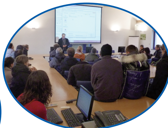
Présentation des projets réalisés ces dernières années par l'AIVE, avant la visite des bassins de dépollution à Arlon.